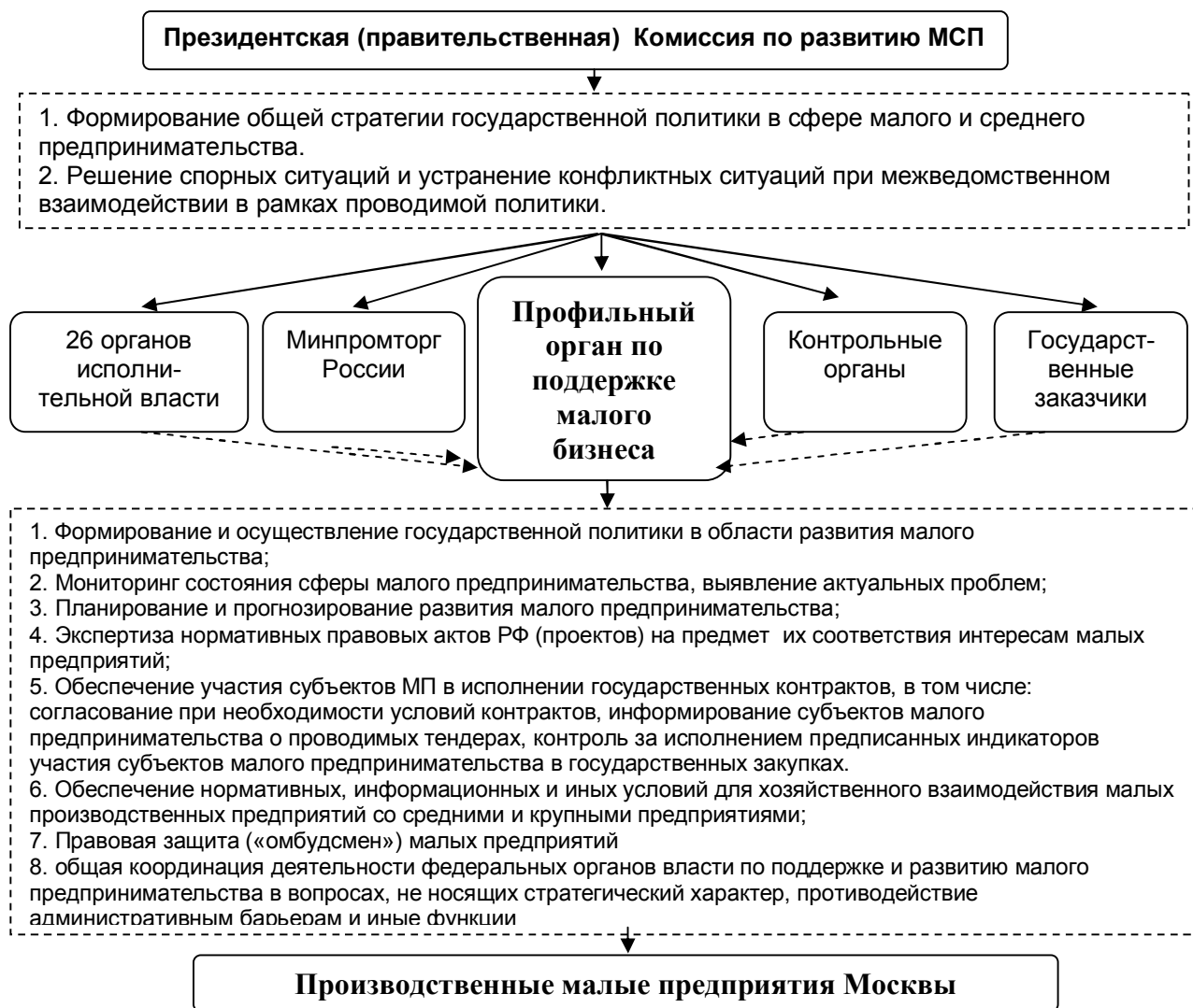
Рисунок 1. Предложения по изменению организации системы управления развитием производственного малого предпринимательства на федеральном уровне.

В работе определены зоны ответственности органов федеральной власти и органов власти города Москвы. Предложенный механизм формирования приоритетов представлен на рисунке 2.