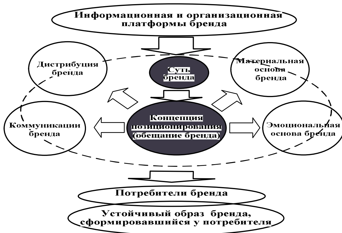
Рисунок 4 – Схема разработки структурных компонентов бренда

На рисунке 4 представлена логика разработки структурных компонентов бренда, лежащая в основе предложенного способа.