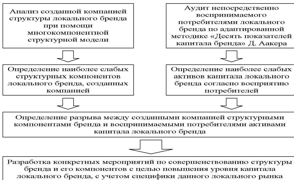
Рисунок 5 – Этапы наделения торговых марок компаний, работающих на локальных рынках, капиталом бренда

В настоящее время 90% российских производителей развивают собственные марки, поэтому необходимо решать вопрос не столько создания новых марок, сколько наделения существующих торговых марок компаний капиталом бренда с учетом специфики локального рынка. Для решения этой задачи автором был разработан метод наделения торговых марок компаний капиталом бренда, основные этапы реализации которого показаны на рисунке 5.