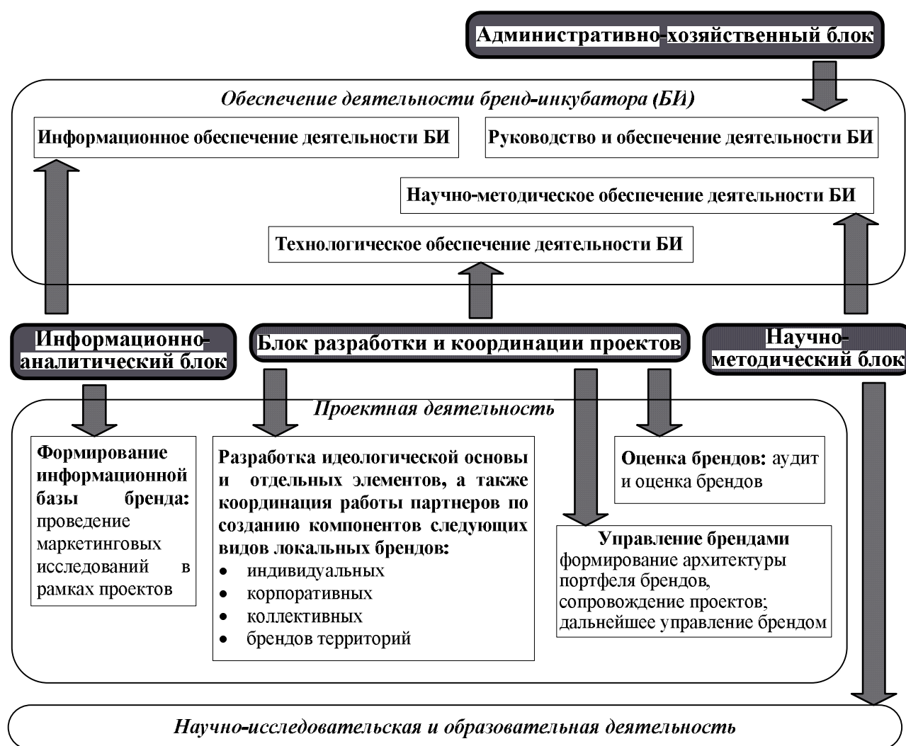
Рисунок 6 – Функции организационных блоков бренд-инкубатора

Направления и содержание деятельности бренд-инкубатора г. Набережные Челны показаны на рисунке 6.